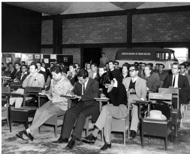
FIGURA 2. Cursos de radioisótopos en las instalaciones de la CNEN, México.